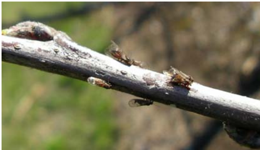
Figura 2: forme svernanti su germoglio.

L'utilizzo di fenoxycarb da solo al picco di ovideposizione (BBCH 53) ha fornito un soddisfacente livello di efficacia (84.9%), valore che si riduceva quasi completamente nel trattamento a pochi giorni da inizio fioritura (23,5%); infine le due tesi a base di diflubenzuron, sia da solo che addizionato di sinergizzante hanno evidenziato un positivo livello di efficacia (da 63 a 85%) anche in considerazione del timing ritardato del loro utilizzo.