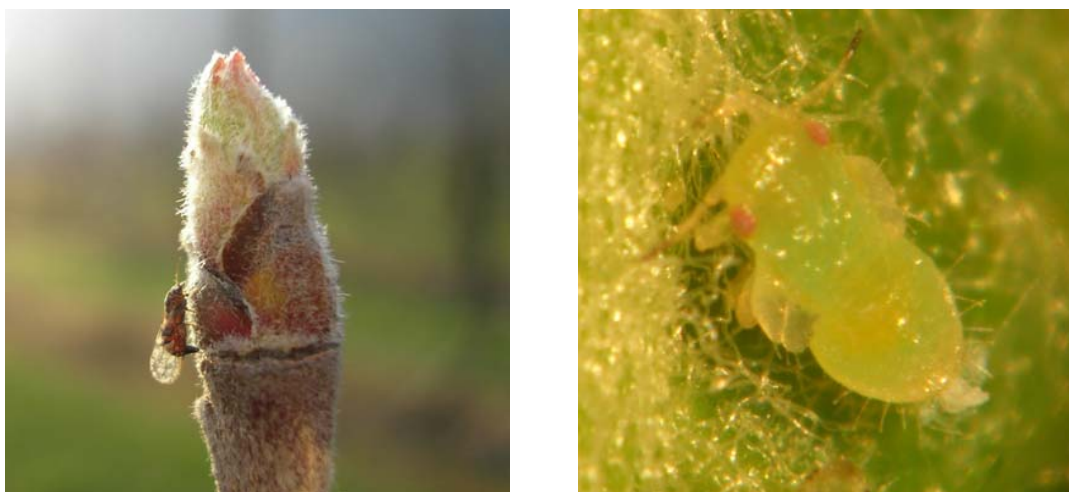
Figura 1: a ) femmina ovideponente di C. melanoneura , b) forma giovanile di C. melanoneura .

I risultati ottenuti sono stati sottoposti ad analisi della varianza (ANOVA ad una via) e successivamente al test di Tukey ( p\geq 0.05 - SPSS Program).